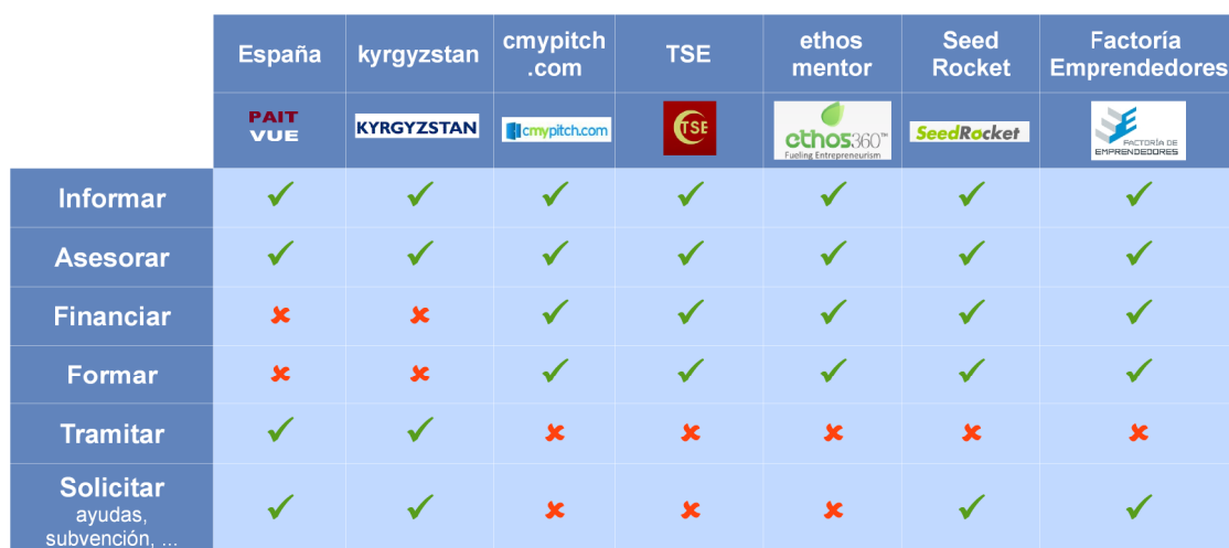
Tabla comparativa de servicios